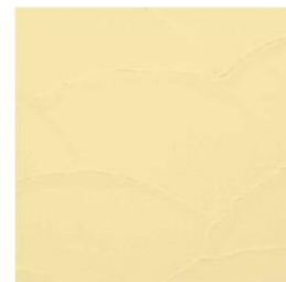
ワイルドランダム